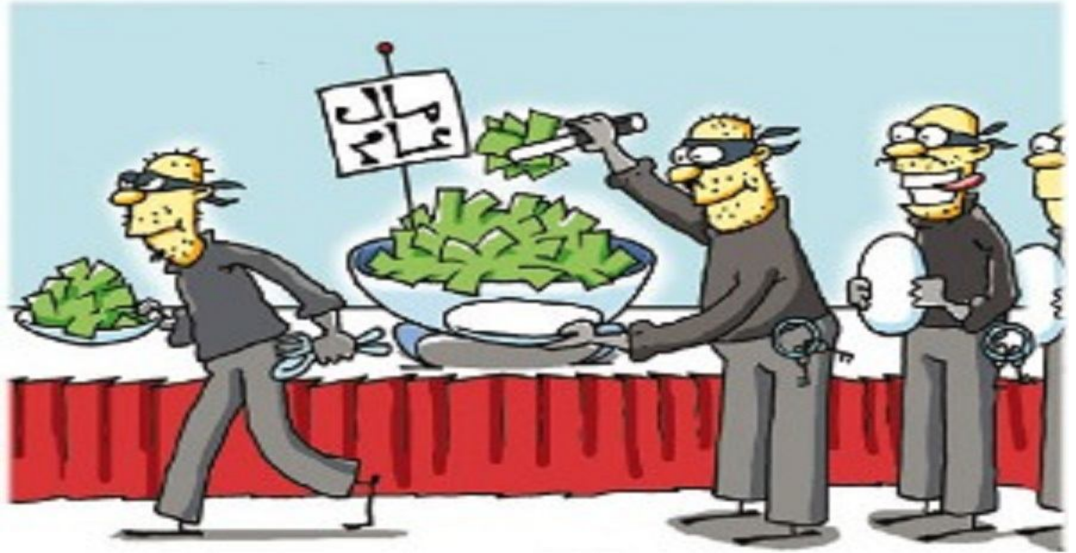
المحافظة على أموال الدولة التي في حوزته أو تحت تصرفه واستخدامها بصورة رشيدة